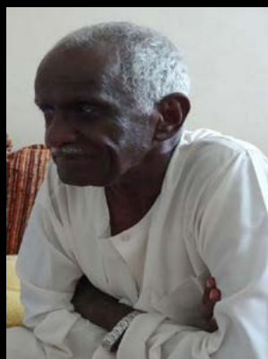
انا لله وانا اليه راجعون

وَبَشِّرِ الصَّابِرِينَ إِذَا أَصَابَتْهُمُ مُصِيبَةٌ قَالُوا إِنَّا لِلَّهِ وَإِنَّا إِلَيْهِ رَاجِعُونَ