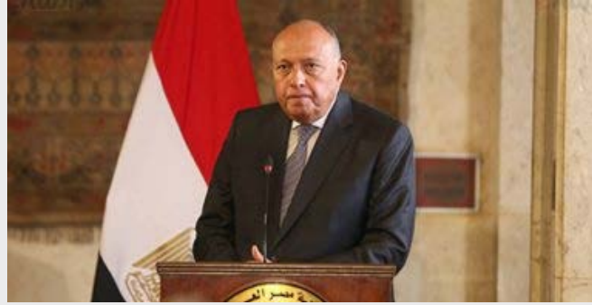
وقال المتحدث باسم الخارجية، إن السفير إيهاب نصر أكد خلال اللقاء أن

مصر سبق وأن حذرت من التدايعات الخطيرة والسلبية لتكرار تلك الاحداث المفروضة، وما تؤدي إليه من تنامي ظاهرة الإسلاموفوبيا وإثارة خطاب الكراهية والتطرف وتشجيع المساعي والأفكار الهدامة الساعية لهدم روابط التواصل الحضاري بين شعوب ومجتمعات العالم. وأكد مساعد وزير الخارجية للشئون الأوروبية في هذا الصدد على الموقف المصري الراسخ والرافض لمظاهر ازدراء