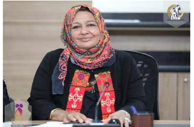
بقلم سهام عز الدين جبريل

يوافق ٢١ يوليو عام ١٩٦٠ مرور ٦٣ عام على هذا التاريخ الذي يحمل ذكري انطلاق أول بث للتلفزيون العربي المصري وما كان يطلق عليه الشاشة الساحرة الفضية ..