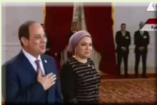
كتبت - هويدا الشريف

المعادلة الوطنية، وذلك بفضل تضحياتها للدفاع عن الوطن، وأشارت إلى أن إزالة العوائق أمام عمل المرأة يرفع إنتاجية الاقتصاد إلى أكثر من ٢٠٪، وأضافت أن أحدًا لا ينكر أن هناك تطور كبير شهدته خطط الإصلاح الإداري على المستوى التشريعي فيما يخص حقوق المرأة وتولي المناصب الإدارية، حيث حققت المرأة مكاسبًا هائلة على كافة المستويات. وأشارت السيدة الزبارة إلى أن ارتفاع عدد القيادات التنفيذية من المرأة إلى ٣ أضعاف يعكس مدى الاهتمام بتمكين المرأة، مؤكدة أن المرأة أصبحت شريكا أساسيا في عملية التنمية. كما أكدت السيدة وزيرة التخطيط، أن الحكومة تنظم العديد من البرامج التدريبية لزيادة انخراط المرأة في سوق العمل مشيرة إلى أنه رغم هذه النجاحات إلا أن هناك عدد من التحديات التي تعيق المرأة المصرية مثل قلة فرص العمل بمجال القطاع الخاص مما يجعل توفير فرصة بديلة للمرأة حمل كبير تتحمله ميزانية الدولة.