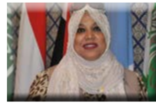
بقلم هناء السيد

واكدت أهمية الاحتفالية والتي تمثل نقطة انطلاق للشعب العربي نحو ترسيخ الانتماء والاعتزاز بالوطن وتوحيد الصف لتحقيق الغاية المنشودة وهي اعداد كوادر شبابية قادرة على دفع عجلة العمل العربي المشترك للامام ومؤهلة لقيادة الدول العربية في المستقبل .