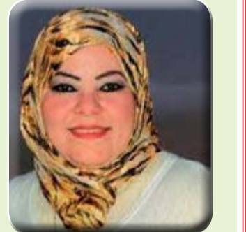
كتبت - هويدا الشريف

تقرر الاحتفال بيوم التراث العالمي يوم ١٨ إبريل القادم وذلك تحت رعاية الإمام الأكبر فضيلة الأستاذ الدكتور أحمد الطيب و الدكتورة إيناس عبد الدايم وزير الثقافة، بالتعاون بين الأزهر الشريف ودار الكتب والوثائق القومية. حيث تقام ندوة دولية بعنوان "القدس تراث لا ينسى" يتحدث فيها عدد من المتخصصين والأكاديميين عن تراث القدس.