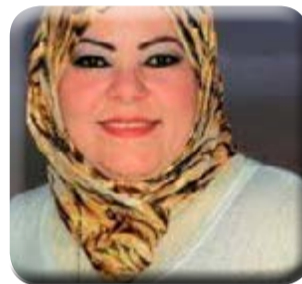
كتبت - هويدا الشريف

العلاقات في المجالات المختلفة، وهو الأمر الذي يكسب أهمية متزايدة لما تنطوي عليه المرحلة الراهنة من تطورات وتحديات، وفي هذا السياق تم استعراض ومناقشة القضايا الإقليمية ذات الاهتمام المشترك، حيث توافقت رؤى وتقدير الرئيسين حول الأوضاع بالمنطقة وأهمية تعزيز العمل المشترك للتوصل إلى تسويات سياسية للأزمات القائمة بالمنطقة مع استمرار التشاور والتنسيق المكثف بين البلدين خلال المرحلة المقبلة.