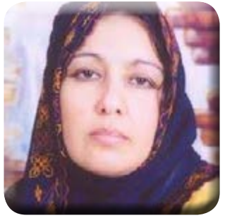
بقلم/ دكتور سهام جبريل

هنا فشلت مخططات القوى الإستعمارية على مر التاريخ،، هنا إنهارت أحلام نابليون بونابرت وهنا تم سحق اليهود ، الجميع ولى وبقي أهلها صامدون منذ عهد الفراعنة والطريق الحربي والتصدى لغارات الهسكوس عندما هزمهم أحمرس الأول في موقعة شاروهين التى تبعد عن مدينة العريش حوالى ثلاثة كيلو مترات من الناحية الشرقية، وكانت موقعة شاروهين هى نهاية الهكسوس على أرض العريش