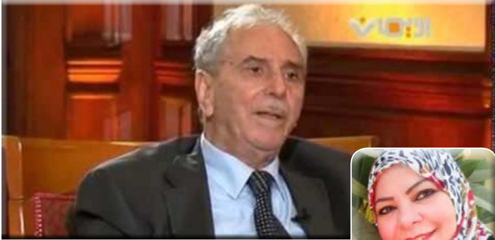
مذهب الإمام الأشعري رجع بالناس إلى ما كان عليه هدي رسول الله