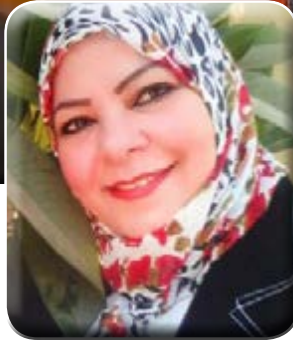
كتبت - هويدا الشريف

تمارسه الجماعات المتطرفة من تكفير وتهجير، حيث تبث أفكارها المسمومة في مجتمعاتنا، مستخدمة النصوص الدينية في غير سياقها الصحيح، بهدف إشعال نار الفتنة في صفوف المسلمين وتشتيت أفكارهم، موضحاً أننا لا يمكن أن نبقي في هذا الوضع الواهن الضعيف، بل يجب أن نعود بمجتمعاتنا للمنهج الوسطي. وأكد د. الطالبي أن الجماعات الإرهابية هي الخطر الأكبر على المجتمعات، لأنها جاهلة بدينها، ولذا فإننا في حاجة لضرورة تغيير حضاري ومنهج جديد تتعدى غايته ووسائله، مشدداً على أن وحدة الأمة الإسلامية لن تتحقق إلا باتباع المنهل العذب، مذهب الإمام