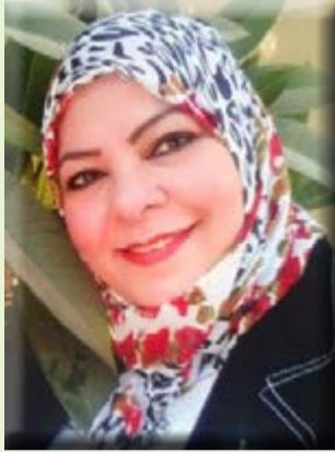
كُتبت - هويدا الشريف

وأضاف المتحدث الرسمي أن السيد الرئيس أكد دعم مصر للجهود المخلصة الرامية إلى تحقيق التهدئة في جنوب السودان، بهدف ترسيخ الأمن والاستقرار. كما أكد السيد الرئيس أن مصر ستواصل مساندة جهود التنمية في جنوب السودان، منوهاً إلى ما يربط مصر بهذا البلد الشقيق من علاقات وثيقة وروابط مشتركة، وأشار سيادته إلى أن مصر ستستمر في تعزيز أطر التعاون الثنائي وتقديم المساعدات والدعم الفني لجنوب السودان، بما يسهم في تلبية تطلعات شعبها نحو مستقبل أفضل.