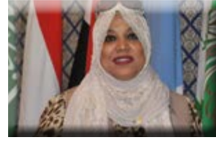
كُتبت: هناء السيد

وسيشارك رئيس البرلمان العربي في كلمته بالقمة العربية التي عقدت برئاسة خادم الحرمين الشريفين الملك سلمان بن عبدالعزيز "قمة القدس" وما صدر عنها من قرارات ومواقف تؤكد مكانة فلسطين وشعبها لدى قادة الأمة العربية، مقدماً تحية إجلال وتقدير باسم الشعب العربي، لخادم الحرمين الشريفين، لمبادرته الكريمة بتسمية القمة "بقمة القدس". ومثمناً عالياً الدعم الذي قدمته المملكة العربية السعودية بالتبرع بمبلغ ٢٠٠ مليون دولار أمريكي لصالح الأوقاف الإسلامية بالقدس، ووكالة الأمم المتحدة لإغاثة وتشغيل اللاجئين الفلسطينيين (الأونروا). كما سيثمن الجهود الكبيرة التي يقوم بها جلالة الملك عبدالله الثاني ابن الحسين لدعم القضية الفلسطينية، ولدور المملكة الأردنية الهاشمية في القيام بواجباتها في الوصاية الهاشمية على المقدسات الإسلامية والمسيحية في