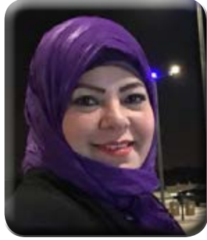
تقرير اعدتة - د. هويدا الشريف

المغربلين ، السروجية ، الدرب الأحمر ، حوش الغجر ، بركة الفيل ، تل العقارب ، درب المهايل ، السكاكيني ، العباسية ، زينب خاتون