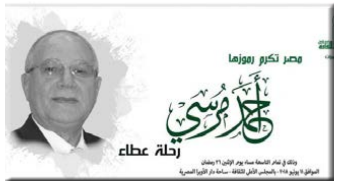
كتب- د. هويدا الشريف

كرائد من أهم رواد التراث الثقافى غير المادى، وذلك يوم الاثنين ١١ يونيو الموافق ٢٦ رمضان فى تمام الساعة التاسعة مساء فى مقر المجلس بساحة دار الأوبرا .