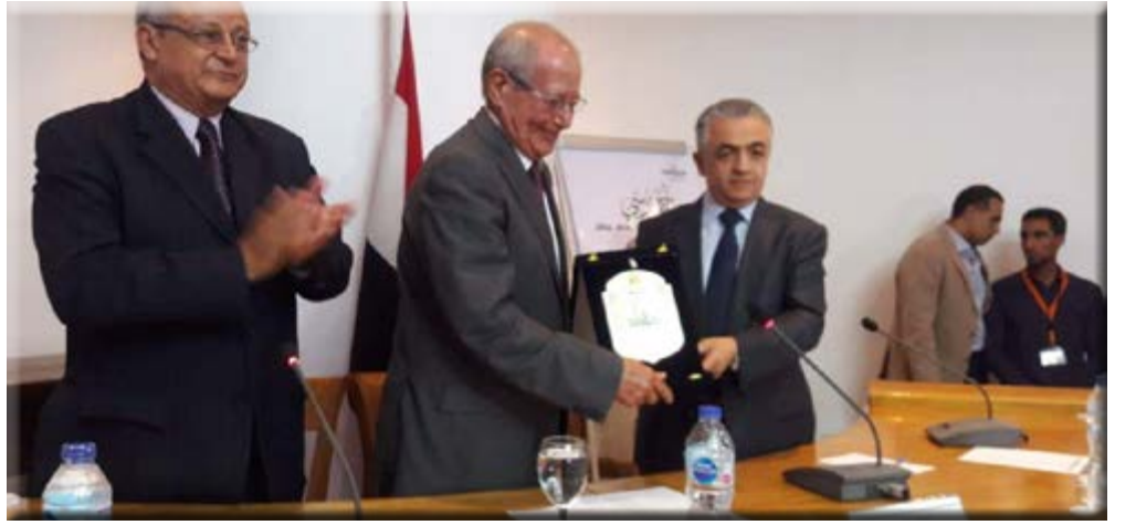
كتب- د. هويدا الشريف

جعلت منى رجلا يدرك تماما واجباته ومسؤولياته اتجاه نفسه وبيته ووطنه، وانتهاز الفرصة لأقدم التحية إلى أساتذتي الذين أدين لهم بالكثير وجعلوني عاشقا لهذا الوطن، مثل الدكتور سهير القلماوى، والدكتور عبد الحميد يونس الذى مازلت أتذكر مقولته " الطالب = أ + ذ " وهى تعنى أن الطالب استمرار وخطوات بعد الأستاذ، عليه أن يضيف ويبدع ويواصل الإبداع والإبتكار .