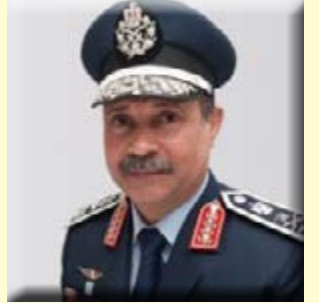
تولى منذ قليل الفريق يونس المصرى، قائد القوات الجوية، منصب وزير الطيران فى حكومة المهندس مصطفى

مدبولى. الفريق يونس السيد حامد المصرى، شغل منصب قائد القوات الجوية الحالى، من مواليد ديسمبر ١٩٥٩، فى محافظة سوهاج، حيث تم تعيينه فى أغسطس ٢٠١٢، قائداً للقوات الجوية، ورقى لرتبة فريق فى إبريل ٢٠١٣. حصل الفريق يونس المصرى، على بكالوريوس طيران وعلوم عسكرية، وماجستير العلوم العسكرية بكلية القادة والأركان، وزمالة كلية الحرب العليا، بأكاديمية ناصر العسكرية العليا، وأيضاً إدارة أزمات بأكاديمية ناصر