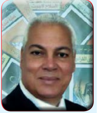
بقلم: عبدالعزيز الغالي

من باب الجغرافيا دخلت سيناء التاريخ.... موقعها صنع تاريخها هي أرض