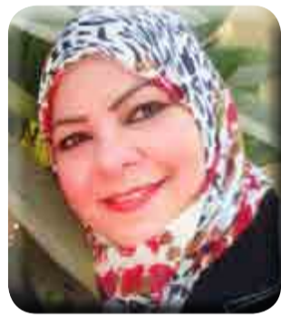
بقلم: د. هويد الشريف

وفي سياق متصل، أفادت مصادر محلية بأن قوات الاحتلال هدمت منزل في قرية بتير غرب بيت لحم جنوب الضفة الغربية لمواطن يدعى رائد أبو حارثية، وذلك بالرغم من وجود ملف ومخططات تفصيلية في حرس أملاك الغائبين.