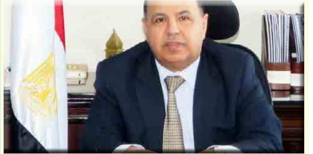
كتبت - د. هويد الشريف

٤ مليار جنيه للهيئة العامة للسلع التموينية ١,٢ مليار جنيه لوزارة التضامن الاجتماعي لمستحقات برنامجي تكافل وكرامة ٨٦ مليون جنيه لسكك حديد مصر وخطوط مترو الانفاق لدعم اشتراكات الطلبة والخطوط غير الاقتصادية ١٠,٦ مليون جنيه للهيئة العامة للتأمين الصحي كدعم لكل من (المرأة المعيلة، الطلاب، الاطفال دون السن المدرسي) ١٢,٥ مليون جنيه الدعم المستحق للشركة القابضة لمياه الشرب والصرف الصحي.