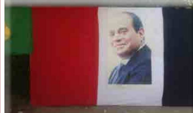
لاصحابه واسترداد مصر لشعبها العزيز بقيادة سياسية حكيمة ووطنية تتمثل في الرئيس عبد