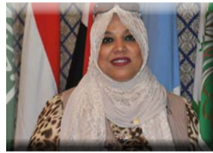
كتبت: هناء السيد

وأماناً من المملكة بدورها الإنسانية، فقد قامت القنصليات العامة في مصر بمنح تأشيرات حج لعدد كبير من الأشقاء الفلسطينيين والسوريين عبر قنصلياتي السويس والإسكندرية، وذلك تقديراً للأوضاع الإنسانية الصعبة التي يعيشها الشعبين الشقيقين.