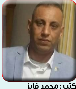
كتب: محمد فايز

إلتقى اللواء/ محمود عشماوي محافظ القليوبية بمكتبه بالديوان العام بالمهندس/ سيد محروس رئيس هيئة الأوقاف المصرية بحضور المهندس/ محمد مديوني مدير منطقة أوقاف القليوبية وذلك للبدء في عمل رسومات تنفيذية ودراسات الجدوى لعدد من قطع الأراضي ملك للأوقاف لبناء مدارس عليها في المراكز والمدن التي تحتاج بشدة لوجود مدارس بها وكذا بناء سوق حضاري على أرض الأوقاف