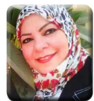
كتبت - د. هويدا الشريف

كما تؤكد الأمانة العامة علي موقفها الثابت من احترام عمل المجتمع المدني العربي ومنظماته وممثليه، وكذا اعتزازها بالجهود الذي يسهم به في دعم تنمية المجتمعات العربية في مختلف المجالات، مع الأخذ في الاعتبار ضرورة اتساق نشاطاته مع القوانين الوطنية المنظمة لعمله.