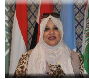
القاهرة هناء السيد

المستفيدين من مشروع "مقاومة الجوع وسوء التغذية" هذا العام وصل لما يقرب من ١٣ ألف أسرة من الأسر الفقيرة في محافظات الأقصر وأسوان والأسكندرية والبحيرة بجمهورية مصر العربية ، و مخيمات النازحين في مقديشو و هيرجيسيا وبيدوا وبلدوين بالصومال ، و مخيمات اللاجئين والنازحين السوريين ومنطقة كياوكتاو بإقليم أراكان بميامار (بورما) بالإضافة الى بعض الأسر الفقيرة بفلسطين. وبذلك يتخطى عدد المستفيدين من مشروع مقاومة الجوع وسوء التغذية "الأضاحي" خلال الأعوام السابقة المليون مستفيد بخمسة عشر دولة حول العالم. وفي تصريح للدكتور أسامة رسلان أمين عام اتحاد الأطباء العرب أوضح ان المشروعات الإغاثية الغذائية الموسمية التي تنفذها لجنة الإغاثة وتهدف إلى