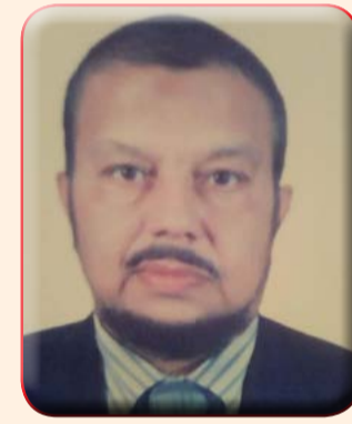
كتب : جمال ضاحي ريان

أطنان الاسماك ليجدوا لهم رزقا حلولا وربحا حسنا حلولا لهم وكنت تجد بائعى الثلج الذى يسمونه الصيادين بلاطات الثلج بلهجتهم وبكلامهم وبلغة البحارة والصيادين وكنت تجد أصحاب اللانشات يؤجرونها لهوات الصيد الذين يستأجرونها منهم والسفر بها حتى ميناء سفاجا بالبحر الاحمر وهذه هوايه وغيه تجدها منتشرة لدى شباب السويس وشيوخها ويوجد أيضا بالسويس معهدا للثروة السمكية وعلوم البحار بالاحياء المائية. وكنا نعلم مطاعم للأسماك بيور توفيق وبالسويس وبعتاقه نأكل اشهى والذ أنواع الجمبرى والكابوريا والبورى والاسماك المشوية والطواجن ويجوارها التحيشه والسلطات وأطباق الطحينه وكان اهالى السويس يفضلون