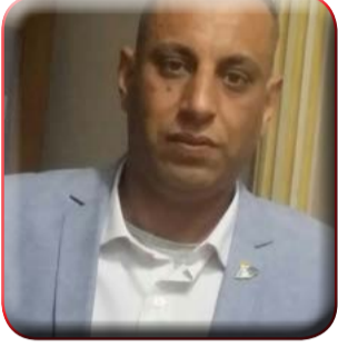
كتب : محمد فايز

إلى دور الوزارة في الإشراف على هيئات الاعتماد، ومشاركتها في لجان المتابعة لتوحيد المبادئ المطبقة بكافة المدارس الأمريكية، والإشراف على ختم الشهادات مععرفة هيئة الاعتماد مع النص على أن يكون ذلك داخل ديوان الوزارة، ضماناً لحقوق الطلاب.