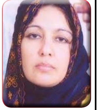
بقلم / سهام عز الدين جبريل

الاقليمية والعالمية ، وبحكم الموقع فإن مصر تنتمي إلى الدول أصحاب المواقع الاستراتيجية ، فبحكم موقعها بين القارات الثلاث أفريقيا واسيا وأوروبا ، حيث يتميز الموقع المصري الممتد الى قارة اسيا شرقا والمتمثل في ذلك المثلث الإستراتيجي الهام الذي يمثل شبه جزيرة سيناء الواقع في محور الثلاث قارات ذلك الجسر البري الذي يربط أسيا بأفريقيا وفي غربها يجري الرافد المائي الذي يربط اوربا وشمال المتوسط بالبحر الاحمر ، حيث تتضاعف الاهمية الاستراتيجية لهذا الموقع بحكم وجود