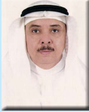
بقلم/ الأستاذ الدكتور محمد بن عبد الرحيم شاهين

الإسهال. حيث أشارت دراسة أجريت على الفوائد الغذائية لثمار الموز أن حوالي ٥٧٪ من المرضى المبحوثين الذين تناولوا رقائق من الموز قد قل الإسهال عندهم مقابل ٢٤٪ من المرضى المبحوثين الذين تم علاجهم طبيًا. ويمكن الحصول على ذلك بتناول الموز الأخضر غير الناضج، لكن يجب الحذر من تناول الموز الطازج الأصفر؛ لأنه يزيد من مشكلة الإسهال. كما تحتوي ثمار الموز على مواد تساعد على نمو البكتيريا الصديقة في الأمعاء، التي تنتج الفيتامينات والأزتيات الهاضمة التي تعمل على تحسين قدرة الجسم على امتصاص العناصر الغذائية، بالإضافة إلى المركبات التي تحمي الجسم ضد الكائنات الدقيقة غير الصديقة.