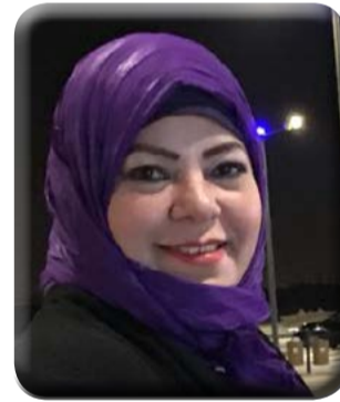
كتبت - د. هويد الشريف

ستيفانو منذ السادسة صباحاً وحتى الثالثة عصرًا، مشيداً بنسبة الاقبال على المسح منذ الصباح الباكر، مضيافاً انه تم مسح ١٣ الف و ٩٦٥ مواطن اليوم. وتناشد وزارة الصحة والسكان جميع المواطنين بالتوجه الى النقاط الطبية للإطمئنان على أنفسهم، حيث تعمل نقاط المسح منذ التاسعة صباحاً وحتى التاسعة مساءً. يذكر انه يوجد خط ساخن ١٥٣٣٥، وموقع الالكتروني www.stophcv.eg لتلقي أى استفسارات من المواطنين عن أماكن إجراء المسح أو أي معوقات قد تواجههم للتعامل معها فوراً.