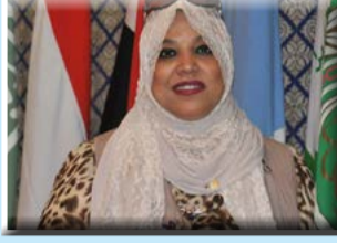
كتبت - هناء السيد

عن الاتحاد البرلماني العربي الرئيس الدكتور علي عبد العال رئيس مجلس النواب في جمهورية مصر العربية