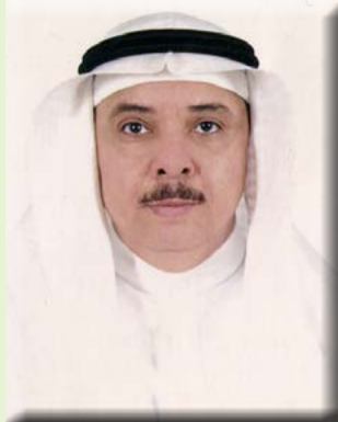
بقلم/ الأستاذ الدكتور محمد بن عبد الرحيم شاهين

فلقد وجد من دراسة أجريت على ٥٦٠٠ فرد فوق سن ٦٥، أن ٥٠٪ منهم كانوا أكثر عرضة للمعاناة من السكتة الدماغية، وذلك مقارنة بالأفراد الذين لديهم كمية قليلة من البوتاسيوم، وبالتالي فإن الأطعمة الغنية بالبوتاسيوم، مثل الموز، قد تقلل من خطر الإصابة بالجلطة الدماغية. وقد توصلت إحدى الدراسات إلى أن تناول الموز قد يساعد على منع تصلب الشرايين، التي يمكن أن تؤدي إلى تطور أمراض القلب، وذلك لأن ثمار الموز غنية بالبوتاسيوم، الذي يمكن أن يقلل من تكلس الأوعية الدموية، حيث يُعتقد أن مادة البوتاسيوم تُنظم الجينات التي تُساعد على الحفاظ على مرونة الشريان. ووجد أن تناول إصبع موز واحد يومياً يُساعد في خفض معدلات ضغط الدم، الذي يعتبر عامل خطر رئيسي للإصابة بالسكتات القلبية. كما ذكرت إحدى الدراسات المنشورة في مجلة نيونجلند الطبية، أن تناول الموز كجزء من حمية منتظمة يمكن أن يقلل خطر الموت بالسكتة بنسبة ٤٠٪.