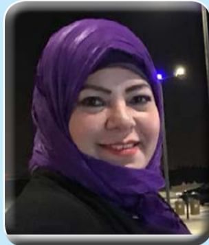
كتبت - د. هويدا الشريف

وأكد الرئيس، تضامن فلسطين ووقوفها مع الاشقاء في جمهورية مصر العربية في وجه هذا العمل الارهابي البشع، الذي لا دين له ولا أخلاق، سائلاً العلي القدير الرحمة للضحايا والشفاء العاجل للجرحي.