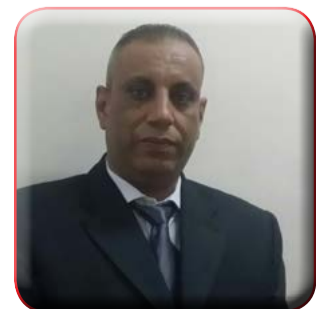
كتب : محمد فايز

المحافظ قد أجرى اتصلا تليفونيا بالسيد اللواء قاسم حسين محافظ المنيا لتقديم يد العون والمساعدة للمصابين فى الحادث مؤكدا أن مستشفيات المحافظة على أتم استعداد لاستقبال أى من المصابين وتقديم أوجه الرعاية الكاملة لهم