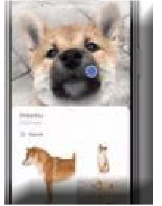
طرحت شركة جوجل ميزة Google Lens

Lens للعديد من الهواتف الذكية بداية من ٢٠١٨، حيث وصلت الميزة لتطبيق الصور الشهير Google Photo وهواتف بيكسل وخدمة الترجمة، إلا أن جوجل قررت توسيع هذه الميزة لتصل إلى هواتف آيفون أيضاً، حيث كان مستخدمو هواتف آبل في السابق يحتاجون لتشغيل تطبيق Google Photo إذا كانوا يريدون استخدام عمليات بحث Lens على أجهزتهم. ووفقاً لما نشره موقع engadget الأمريكي، فقد طرحت جوجل هذه الميزة أخيراً لتطبيق البحث الخاص بها على منصة iOS، حيث سيظهر