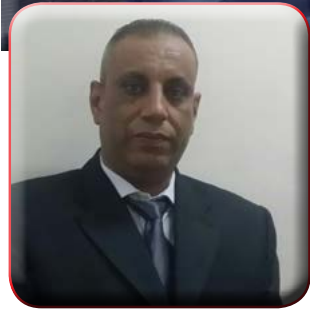
كتب : محمد فايز

والعلاج للمصابين كاملاً بالمجان بمراكز العلاج المتخصصة لذلك ، وتجدر الإشارة الى انه تم تجهيز ٢٥٦ نقطة تركز ممدن وقرى المحافظة لاستقبال المواطنين للفحص الفوري المبدي لفيروس سى بالإضافة الى توفر ١٨ مركز طبي بالمستشفيات لاستكمال الفحوصات وتلقى العلاج والمبادرة مستمرة حتى ٣١ ديسمبر ٢٠١٨