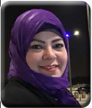
كتبت - د. هويدا الشريف

من إدراكها العميق ووعيها الكبير للأخطار التي تهدد العالم العربي، وتؤكد بخطوات عملية حرصها الشديد على مساندة الدول العربية.