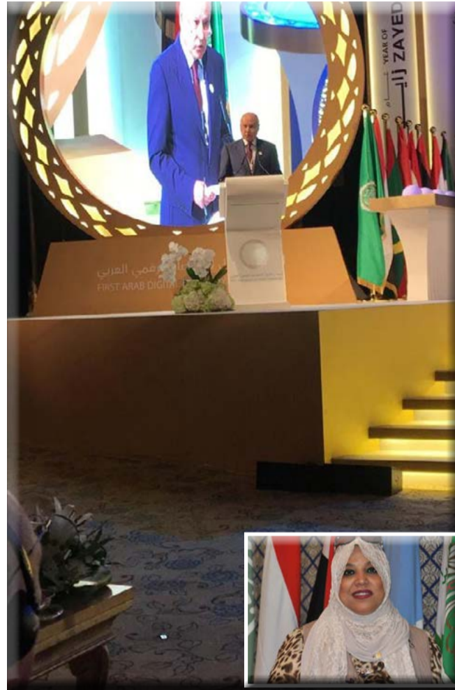
كتبت - هناء السيد

وأشار أبو الغيط في تصريح له من أبو ظبي - حيث يشارك في مؤتمر حول الاقتصاد الرقمي في المنطقة العربية - إلى أن " الاعتراف فقط بالقدس الغربية كعاصمة لإسرائيل مع تجاهل الاعتراف بأن القدس الشرقية هي عاصمة لدولة فلسطين إنما ينطوي على انحياز واضح تجاه الموقف الاسرائيلي مع تجاهل حقوق الفلسطينيين الثابتة والمشروعة في القدس الشرقية عاصمة لدولتهم " . وأضاف الأمين العام " اذن الموقف الاسترالي منقوص.. ولذلك هو يثير انزعاجنا لأنه ينطوي على تحيز صارخ لإسرائيل.. وعندما تطرق اعلانهم الى فلسطين تعمد أن يكون غامضاً ولم يتضمن اعترافاً بدولة فلسطين ولكن تحدث عن أن بقية القدس.. يعني الشرقية.. هي موضع تفاوض.. وهذا ما نرفضه بشكل قاطع " . وتابع الأمين العام تصريحه قائلاً " أدعو الحكومة الاسترالية لتصحيح موقفها والاعتراف بدولة فلسطين وعاصمتها القدس الشرقية دون ابطاء.. بهذا سنعتبر موقفها متوازناً " .