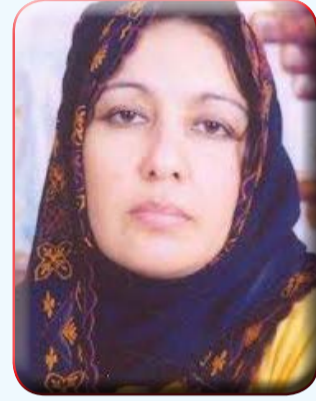
بقلم / سهام عز الدين جبريل

واستقروا بها وهذا مادفعني للبحث عن تاريخ هذه الواحة والتشوق لزيارتها ولماذا اختار بهاء طاهر هذه المنطقة بالذات لرواية تجسد وترجم خفايا هي صراع بين الماضي والحاضر وايقظ صراع بين الغرب والشرق، فهي من أروع ما قرأت، فالرواية فجم ما يميزها هي أن الكاتب يأخذك في جو ساحر ويعرفك علي أماكن لم تكن تعرف عنها إلا أسمها ثم يخرج بك من الرواية إلي أحداث تاريخية ثم يعود بك مرة أخرى إلي الرواية بأسلوب جديد من نوعه، وفي رأي أنه يعود سر قوة الرواية إلي عبقرية الكاتب في اختيار الزمان والمكان والأشخاص والتي ضمنت له حظ كبير من المزج بين الشخصيات وتدفق الأحداث أعجبيني جدا قدرة الكاتب علي رؤية الموقف بأكثر من منظار واحد ومن ثم سرده بطريقة شيقه، تابعت مسلسل واحة الغروب الذي عرض في العام الماضي وتابعة مرة أخرى مع إعادة عرضه مرة أخرى بالفعل مسلسلاً رائعاً مما شوقني لقراءة القصة ذاتها وتصور مشاهدتها وأحداثها في مخيلتي التي كان له مذاقاً أكثر متعة،