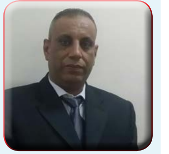
كتب : محمد فايز

لهم عاما سعيدا ومزيدا من التقدم والأمان كما قام سيادته بتقديم التهنئة للأخوة الأقباط بمناسبة أعياد الميلاد المجيدة مؤكداً علي روح الاستقرار والمحبة تعم مصر وستظل دائما مصر رمزاً للمحبة والسماحة في جميع الأديان ونسيجاً وصفاً واحداً. وأكد المحافظ على رفع درجة الاستعدادات القصوى لمحيط الكنائس تزامنا مع الاحتفال بأعياد الميلاد المجيد، مكلفا رؤساء المدن والأحياء بالتنسيق مع جميع الجهات المعنية والمرافق لرفع درجات الاستعداد والاهتمام بنظافة المناطق المحيطة بالكنائس وإزالة كل الإشغالات التي تعوق حركة المواطنين، وتكثيف الحملات الرقابية خلال الأيام القادمة.