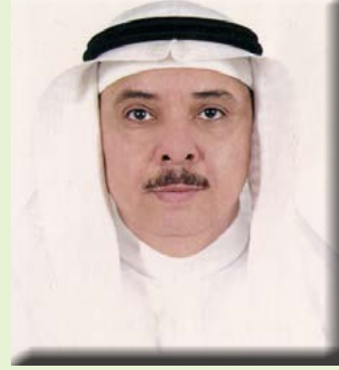
بقلم/ الأستاذ الدكتور محمد بن عبد الرحيم شاهين

المعدة، وذلك في مفيدة جدا في علاج التهابات القولون والإمساك والإسهال لاحتوائها على كربوهيدرات سهلة الهضم لا توجد في أي نوع آخر من الفاكهة، كما أنها تحتوي أيضاً على مثبطات الأنزيم البروتيني، الذي يقضي على البكتيريا التي تسبب قرحة المعدة. وبشكل مختصر هي مفيدة جدا لعلاج مشاكل اضطرابات المعدة. ويمكن لمريض القرحة تناول حبة موز واحدة مع كوب من الحليب الدسم ذي القشدة، وذلك قبل تناول الوجبة الغذائية بحوالي نصف ساعة مع ضرورة أن يكون الحليب بارداً.