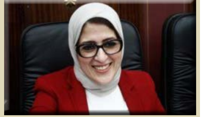
كتبت - د. هويدا الشريف