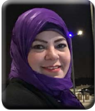
كتبت - د. هويدا الشريف

كما كشف السفير حسام زكي، عن أن الجامعة العربية تبذل جهوداً كبيرة خلال الفترة الحالية للإعداد لثلاث قمم خلال الثلاثة أشهر المقبلة، وهي القمة الاقتصادية والتنموية الرابعة التي تستضيفها لبنان ١٩ و٢٠ يناير القادم، والقمة العربية الأوروبية التي تعقد في مصر ٢٤-٢٥ فبراير