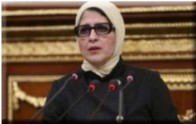
انتهائها، على أن تقدم الدعم الكامل للمحتفلين في الطوارئ. وقالت الدكتورة هالة زايد وزيرة

وأضافت وزيرة الصحة أن هناك متابعة قوية من رؤساء القطاعات لغرفة العمليات، مضيفاً أنه تم استكمال كل احتياجات المستشفيات من أدوية الطوارئ والمستلزمات الطبية.