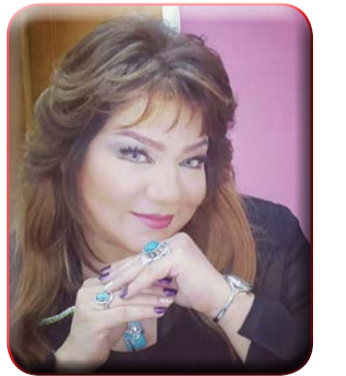
بقلم: عبير محمود