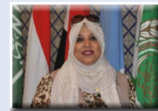
كتبت - هناء السيد

السودان وجمهورية اليمن وجمهورية جيبوتي ومراقبين من جمهورية الصومال الفيدرالية. وأشاد رئيس البرلمان العربي بالجهود المقدره لخدام الحرمين الشريفين الملك سلمان بن عبد العزيز وولي عهده الأمين الأمير محمد بن سلمان في الدعوة لعقد واستضافة الاجتماع الذي أفضى للتوصل إلى إنشاء هذا الكيان الهام، والدور المحوري الذي تقوم به المملكة العربية السعودية في ظل الظروف الدقيقة التي يشهدها العالم العربي لتعزيز التعاون والتنسيق بين الدول العربية وحفظ الأمن والسلم والاستقرار في المنطقة والعالم. وأكد رئيس البرلمان العربي إن أهمية هذا الكيان تنبع من كونه ركيزة أساسية في حفظ الأمن القومي العربي،