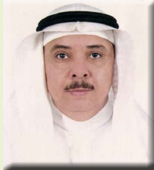
بقلم/ الأستاذ الدكتور محمد بن عبد الرحيم شاهين

خصائص مهدئة، مثل فيتامين ب٦ الذي يعمل على تنظيم مستويات السكر في الدم. كما أن ثمار الموز تحتوي على المغنيسيوم، الذي أثبت الباحثون أنه يساعد على تخفيف بعض الأعراض المصاحبة للحيض مثل الصداع والتشنجات. وقد وجد أن تناول ثمار الموز المطبوخة مع اللبن الرائب يعتبر علاجاً فعالاً لاضطرابات الطمث والأنزفة، حيث أنه يساعد على زيادة هرمون البروجسترون.