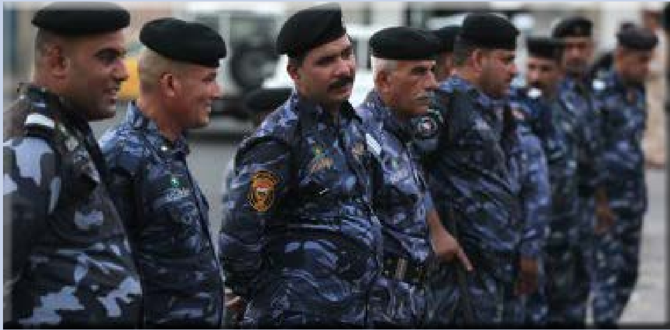
أفاد مصدر أمني عراقي، أن قوة أمنية عثرت على امرأة مختطفة تعرضت للاغتصاب وسرقة بعض أعضائها البشرية شمالي العاصمة بغداد، مشيرا إلى أن القوة نقلت المرأة إلى مستشفى قريب وهي في حالة حرجة جدا. وقال المصدر، في حديث لـ

السومرية نيوز، إن "قوة أمنية عثرت، مساء الجمعة، على امرأة تبلغ من العمر ٣٤ عاما كانت مختطفة وهي في حالة صحية سيئة ضمن منطقة الشعلة، شمالي بغداد"، مبينا أن "القوة نقلت المرأة الى مستشفى قريب لغرض تلقي العلاجات اللازمة". وأوضح المصدر، أنه وبعد نقلها الى المستشفى "تبين أن المرأة تعرضت للإغتصاب القاسي وسرقة أعضاء بشرية منها تحت تأثير المخدر"، مشيرا إلى أن "المرأة الآن في العناية المركزة وهي في حالة حرجة جدا". وتشهد بعض مناطق العاصمة بغداد، بين حين وآخر أحداثا عنف وسرقة وخطف، وتتمكن القوات الامنية من القبض على غالبية المنفذين في عمليات امنية استخبارية.