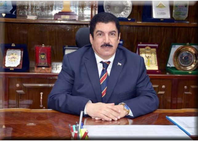
كتب : محمد فايز

في اطار الجهود التي تخطوها محافظة القليوبية في كافة المجالات لدفع عجلة التنمية ورفع مستوى الخدمات لمواطني المحافظ، ارسل اللواء محمود شعراوي وزير التنمية المحلية خطاب شكر إلى الأستاذ الدكتور/علاء عبد الحليم مرزوق محافظ القليوبية أشاد فيه بالجهد والمظهر المشرف للمحافظة في الاعداد الجيد لمشروع موازنة العام المالي ٢٠٢٠/٢٠١٩ والذي تم مناقشته في ديسمبر ٢٠١٨ تحت إشراف وزارتي