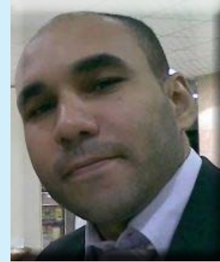
بقلم أ/ رضا عبداللطيف

الدين وتنقل من كنيسة إلى أخرى بعد أن ترك دين أجداده المجوسية، حتى وصل عند رجل في عمورية، فأعلمه أنه سيخرج نبي في أرض العرب وأعطاه ثلاث علامات في النبي، فخرج رضي الله عنه باحثاً حتى وصل إلى المدينة المنورة بعد بيعه لرجل يهودي، وعندما جاء الرسول صلى الله عليه وسلم مهاجراً من مكة المكرمة راح سلمان الفارسي يتبعه حتى تأكد من علامات النبوة اليهود.