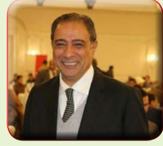
لواء ناصر قطامش

والامراض غير السارية بمراحلها الاولى والثانية والتي تستهدف فخص ٥٠ مليون مواطن مصري يجد ان تفاعل المصريين مع الحملة بكل مكوناتها غير مسبق فقد مر على مصر عصور كثيرة لم يستطيع اي مسئول وعلى النوعية ولا بهذه الكيفية التي غطت بالفعل أماكن وإعداد بعرض وطول الوطن ووصلت ربما لقرى ونجوع لم يسمع بها احد ولا يخفى ان مثل هذه المبادرات لها عدة ابعاد لا يدركها الا من يستوعب جيدا ما يعانیه الناس خاصة البسطاء منهم فطوال السنوات الماضية عانى كثير من المصريين خاصة الغلابة ومن أنهكتهم وشغلهم لقمة العيش حتى عن الاطمئنان على أعلى ما يملكون وهي صحتهم بل وربما يعيش غالبيتهم بأوجاع وامراض لا يهتم حتى بمعرفتها وجاءت مبادرة ١٠٠ مليون صحة لتؤكد على اصرار الرئيس الانسان على المضى قدما في تنفيذ الاستراتيجية المنهجية بمحاصرة المشاكل الحقيقية ومواجهتها بشكل مباشر وبحلول غير تقليدية ودون انتظار وبدء السيسى بمثلت