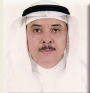
بقلم/ الأستاذ الدكتور محمد بن عبد الرحيم شاهين

مواد ديوسجينين، وإيسوفلافون، وهي مماثلة للهرمون الأنثوي الإستروجين الذي يخفف من أعراض سن اليأس، لذا فتناول مغلي الحلبة يساعد على تقليل أعراض سن اليأس مثل: الاكتئاب، والتشنجات، كما يعمل على تشييط انقباضات الرحم مما يُسهّل الولادة. وتحتوي بذور وأوراق نبات الحلبة على مضادة للالتهابات والأكسدة، والعديد من الإنزيمات، وبالتالي يمكن استخدامها لعلاج الندبات، والدمامل، والأكزيما، والحروق على البشرة، والمساعدة في الحد من الالتهابات، مثل التهاب المفاصل، ومكافحة الجذور الحرة التي يتم إنشاؤها في الجسم على أساس يومي. ونظراً لاحتواء بذور الحلبة على مادة ديوسجينين الستيرويدية التي تعمل كضد للسرطان، بالإضافة للمواد عديدة التسكر، مثل: السابونين، والهيميسيلولوز، والتانين، والبكتين التي تُقلّل من مستوى الكوليسترول في الدم، فإن لها آثار مضادة لسرطان البروستاتة والبنكرياس، والقولون، الثدي، وقد وجد أن تناول بذور الحلبة يخفض في نمو الأورام بنحو ٢٥ - ٤٠٪. كما تُشير الدراسات أنّ تناول زيت بذور الحلبة على شكل قطرات في الفم تحسّن من عدد الحيوانات المنوية لدى الرجال، وكذلك يستخدم الحلبة كل من الرجال والنساء لتحسين الحياة الجنسية والوظيفة الإنجابية.