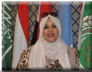
كتبت - هناء السيد

الجولان المحتل. كما أكدوا على أن هذا القرار الأمريكي لا يغير شيئاً من الوضعية القانونية للجولان السوري بوصفها أرضاً احتلتها إسرائيل عام ١٩٦٧ وليس له أي أثر قانوني إذ لا ينشئ أي حقوق أو يترتب عليه أية التزامات أو مزايا. وشددوا على أن شرعية الاحتلال أمر مرفوض كلياً ويمثل ردة كبيرة في الموقف الأمريكي ويقوض تحقيق السلام في الشرق الأوسط على أساس مبدأ الأرض مقابل السلام. وعبر القادة عن تقديرهم للمواقف المبدئية التي اتخذتها عدد من الدول والمنظمات الدولية والإقليمية برفض القرار الأمريكي والتأكيد على تمسكها باحترام القانون الدولي وميثاق الأمم المتحدة وقرارات الشرعية الدولية. وفي الوقت ذاته، حذر القادة العرب من خطورة قيام أي دولة بتجاوز الشرعية الدولية والتفكير في الإقدام على إجراء مشابه للإجراء الأمريكي. وطلب القادة من الأمين العام متابعة التطورات في هذا الشأن وتقديم تقرير حولها إلى مجلس جامعة الدول العربية على المستوى الوزاري في دورته القادمة.