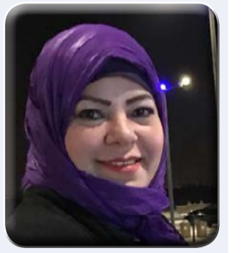
كتبت - د. هويدا الشريف

وأوضح المحافظ أن هناك مساحة ٨٥ ألف فداناً متاحة لزراعة البنجر لتوفير احتياجات المصنع لإنتاج السكر ، وأن الاستثمار المطروح فى المنطقة الصناعية لكافة المستثمرين بالضوابط والنسب المقررة ، وأنه يجري التنسيق مع الجهات المعنية من أجل تمتع المشروعات المقامة فى المنطقة بالضوابط والتيسيرات المقررة .. مشيراً الى أن المنطقة تتمتع بمميزات تنافسية كبيرة .. حيث تقع على بعد ٨٠ كيلومتراً من محور قناة السويس والإسماعيلية ٨٠ كيلومتراً من ميناء بورسعيد والعريش ، وذلك علاوة على قربها من بحيرة البردويل وكذا قربها من الطريق الدولى