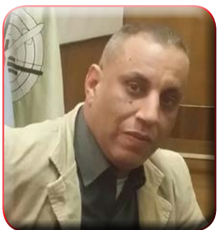
كتب : محمد فايز

وان يوفقكم لما فيه الخير والتقدم والازدهار ونعاهد الله ونعاهد سيادتكم على المضي قدما في مسيرة التنمية وبناء الوطن كما بعث السيد المحافظ ببرقيات تهنئة للاستاذ الدكتور مصطفى مدبولي رئيس مجلس الوزراء والسيد الفريق اول محمد زكي وزير الدفاع والإنتاج الحربي والقائد العام للقوات المسلحة والسادة الوزراء والمحافظين والسيد الاستاذ جبالى المراغى رئيس الاتحاد العام لنقابات عمال مصر