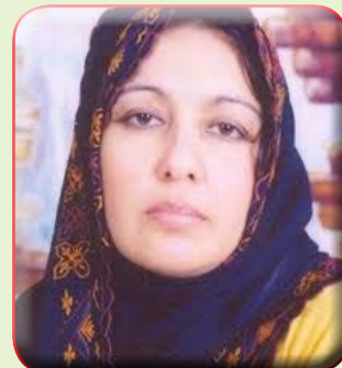
بقلم / سهام عز الدين جبريل

اليوم هو يوم غير عادى انه يوم عودة سينا يوم إحتضان الوطن ، ومازال شريط الذكريات النابض بتسجيل هذه الذكرى يعود ليشع بنوره ويعيد إنتاج ، فيضان الذكريات التي تعيد اشراقات ذلك اليوم العظيم وما تجسده موا قف لاحداث لهذا اليوم ولوحاته النابضة من احداث ومشاهد لاتقدر بكنوز الدنيا كلها ، انها مشاهد لإحتضان الوطن ، وهل هناك أعلى من أن يحتضن الوطن ابناؤه وأرضه العائدة بعد سنوات مريرة من الأحتلال ، وهل هناك أروع من أن يحتضن ابناء الوطن ووطنهم الذي حررهم من نير اسلاك العزلة وسنوات الحرمان انه يوم من ايام الوطن العظيمة ، لقد حظيت بأن أكون ي من ابناء هذا الجيل الذي عاش ذلك المشهد وسجلت ذاكرتي كل لحظاته النابضة ، فيوم العودة كان يوما غير عاديا ، فهو يوم احتضان الوطن حلم كنا نحلم به ونحن اطفال صغار حلم ابناء جيلي ممن حرمو ان يعيشوا طفولتهم تحت حماية درع الوطن ، واستيقظت سنوات طفولتهم البريئة واحلامهم الصغيرة على سطوة مجنزرات الاحتلال البغيض ، فقد عاشت طفولتنا سنوات طويلة مريرة كان زادها شعلة الوطنية ورحيق حلم التحرير الذي ولد وعاش في تلك القلوب الغضة والنفوس البريئة والعقول المستنيرة ، كان حلمنا هذا الذي نسجته حكاوي الامهات والجدات وكنا نسمعه في كل لحظة يردد الاباء والاجداد متى يوم العود ألا إن نصر الله قريب ، عشنا سنوات نتشارك الحلم بمح الاياء والاجداد بالامهات والجدات ، نسجة وجداننا وصنعتة خيالنا فكانت جكاوينا كلها ماذا سنعد لهذا اليوم العظيم ، يوم احتضان اليوطن حقا إنه يوما مشهودا فمن قبلها بعدة شهور بل ومن قبلها بسنوات ونحن نعد لهذا اليوم الموعود ، فمنذ استلام مدينة العريش في مايو ١٩٧٩م وأستكمال المرحلة (ب) والتي كانت حدودها حتى الريسة والتي كانت