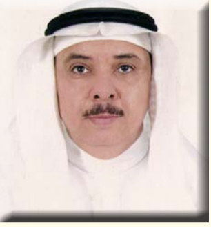
بقلم/ الأستاذ الدكتور محمد بن عبد الرحيم شاهين