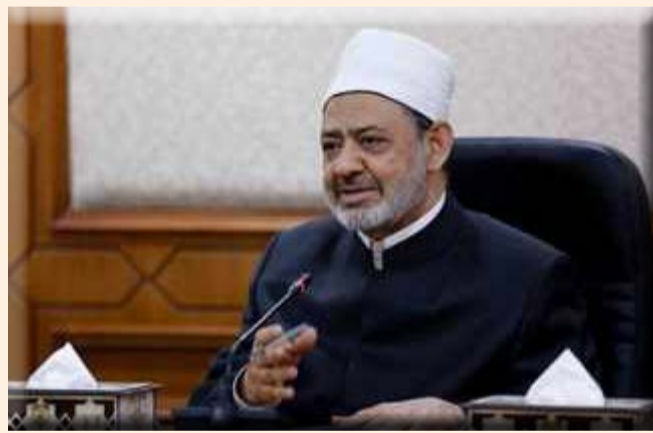
يعد أحد أهم المؤسسات التي يقوم الأزهر من خلالها بهذا الدور، بالتعاون مع الكنيسة المصرية. وأكد حرص الأزهر على مد جسور

أكد الإمام الأكبر الدكتور أحمد الطيب، شيخ الأزهر، استعداد الأزهر لتوثيق أواصر التعاون مع كندا كواحدة من الدول التي تمثل نموذجاً للتعايش والتسامح الاجتماعي على أرضها. وأوضح شيخ الأزهر، خلال لقائه جورج فيري، رئيس مجلس الشيوخ الكندي، والوفد المرافق له، الذي يزور القاهرة، اليوم الإثنين، أن الأزهر يعد أعرق مؤسسة تعليمية مازالت تقوم بدورها منذ أكثر من ألف عام، حيث يدرس فيه ملايين الطلاب في مختلف المراحل الجامعية، كما يقوم بدور اجتماعي هام بتسيخ قيم السلام والتعايش الاجتماعي. وأشار إلى أن "بيت العائلة المصرية"