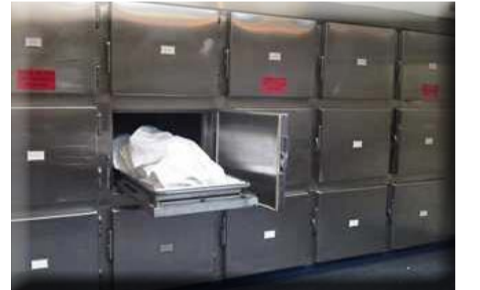
أقدم شاب في العقد الرابع من عمره على التخلص من حياته شنقاً القمح بالشرقية، وتحرر المحضر