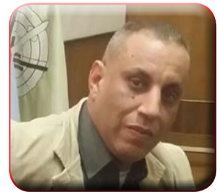
كتب : محمد فايز

الأعمال وتسليم الممشى في أقرب وقت ممكن كما أبدى سيادته الملاحظات وأمر ملاحظتها فوراً لصالح العمل ليظهر بالشكل اللائق والمناسب لمواطني المحافظة.