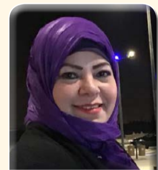
كتبت- د. هويدا الشريف

الأمم المتحدة وقواعد القانون الدولي تلزم الكيان الغاصب بعدم المساس بالأوضاع على الأرض ومنع أية إجراءات تخالف ذلك. ويشدد الأزهر الشريف على أن القدس هي العاصمة الأبدية لدولة فلسطين المستقلة، وهي ليست فقط مجرد قضية أو أرض محتلة؛ بل هي حرم إسلامي مسيحي مقدس، وقضية عقدية إسلامية - مسيحية. كما يدعو الأزهر كل الهيئات والمنظمات العالمية إلى الحفاظ على الوضع القانوني لمدينة القدس، وتأكيد هويتها، وتخليصها من الاحتلال الصهيوني.