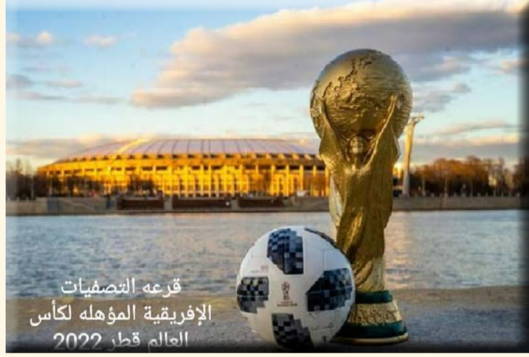
قرعة التصفيات الإفريقية المؤهلة لكأس العالم قطر ٢٠٢٢

١- الدور التمهيدي: - المنتخبات الـ ٣٦ الأعلى تصنيفاً، وفقاً لتصنيف فيفا سيتم اعفائهم من الدور التمهيدي، على أن يخوض هذه المرحلة ٢٨ منتخباً. المنتخبات الـ ١٤ الأعلى في تصنيف من بين المنتخبات الـ ٢٨ المشاركة في الدور التمهيدي ستخوض مباراتي ذهاب