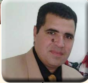
فيصل ابو هاشم شمال سيناء

قام الفريق / محمد فريد رئيس أركان حرب القوات المسلحة بزيارة قوات التأمين المتمركزة بشمال سيناء والتي تؤدي مهامها فى تنفيذ الخطط الأمنية المحكمة لمحاصرة وتضييق الخناق على العناصر التكفيرية والقضاء عليها فى مناطق مكافحة النشاط الإرهابي .