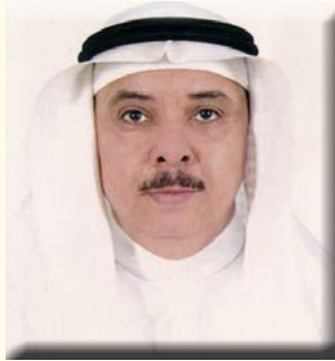
بقلم/ الأستاذ الدكتور محمد بن عبد الرحيم شاهين

على مستويات عالية جدا من أحماض أوميغا-٣ الدهنية، كما أنه يساعد على تقليل كمية الكوليسترول "الضار" في الجسم وتعزز توازن الكوليسترول في مجرى الدم. وكذلك يقلل من تصلب الشرايين، والنوبات القلبية، والسكتات الدماغية، ويخفض ضغط الدم لاحتوائه على البوتاسيوم الذي يعمل على انبساط الأوعية الدموية. كما أنه يساعد على خسارة الوزن، وذلك لأنه منخفض جدا في السعرات الحرارية، وغني بالألياف الغذائية، وبالتالي من يتناوله يشعر بالشبع، مع حصوله على قليل من السعرات الحرارية، الذي يؤدي إلى