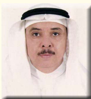
بقلم/ الأستاذ الدكتور محمد بن عبد الرحيم شاهين

لاحتوائها على عنصر البوتاسيوم. كما أن تناول ثمار البرقوق يساهم في التقليل من الكوليسترول الضار في الدم، لأنها تحتوي على الألياف الغذائية القابلة للذوبان، مما يقي من خطر الإصابة بأمراض الأوعية الدموية والقلب. كما تمتلك ثمار البرقوق القدرة على امتصاص الحديد (لأنها تحتوي على فيتامين ج)، حيث يعمل الحديد على تكوين خلايا الدم الحمراء، وتحسين الدورة الدموية، ومنع الإصابة بفقر الدم. كما أن تناول ثمار البرقوق يحافظ على صحة الجهاز العصبي، وذلك لمحتواها من فيتامين ب٦، الذي يساعد في نقل الإشارات العصبية وتحسين عمل الجهاز العصبي، وهو الدماغ الطبيعي، وتحسن المزاج، وإنتاج مادة السيروتونين الناقل العصبي. كما يلعب تناول ثمار البرقوق دوراً هاماً في تحسين النوم، الشهية، وتحسن صحة