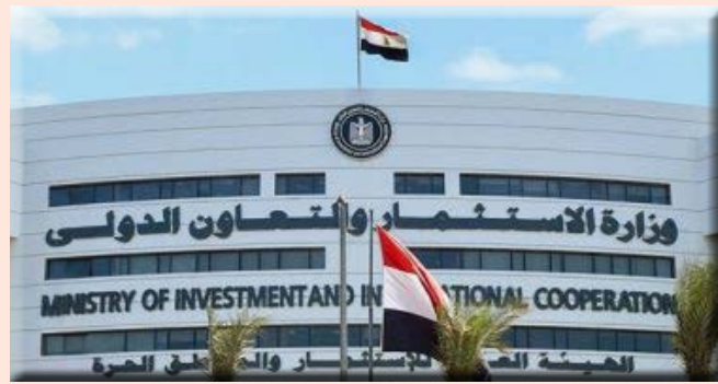
بالأرقام.. ارتفاع النمو الاقتصادي من ٢٪ إلى ٦,٥٪ وتضاعف الاستثمار