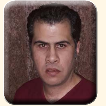
كتب حسين الطنجير

ولعل الحقائق التالية تمثل الدليل على عبثية حديث أردوغان عن العدالة، فلم يعد خافياً على أحد