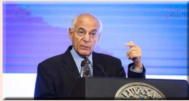
ناسا تطلق اسم العالم المصري فاروق الباز على كويكب اكتشفته حديثاً