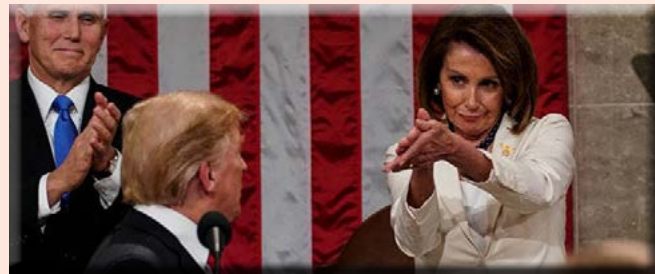
بيلوسبي تعلن بدء إجراءات عزل ترامب.. ماذا سيحدث؟