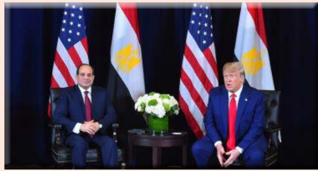
ترامب خلال لقاء الرئيس: الفوضى عمّت مصر وتوقفت بهجىء السيسي