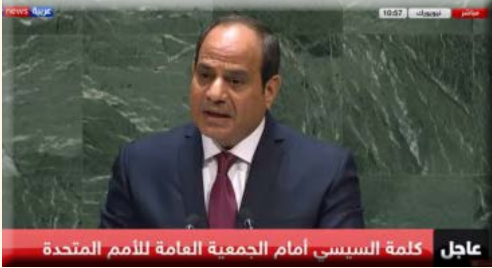
عاجل كلمة السيسي أمام الجمعية العامة للأمم المتحدة

قال الرئيس عبد الفتاح السيسي، إن العالم يواجه تحديات صعبة تستدعي أن نفتح حواراً حول تطوير عملنا تحت مظلة الأمم المتحدة، وانطلاقاً من إعلاء القيم السامية التي تم إنشاء المنظمة. وأضاف الرئيس السيسي، خلال كلمته أمام الدورة الـ ٧٤ للجمعية العامة للأمم المتحدة والمنعقدة في مدينة نيويورك بالولايات المتحدة الأمريكية، أن مصر عضو مؤسس للأمم المتحدة وعدد من المنظمات مثل الاتحاد الأفريقي، مشدداً على أن مصر لديها رؤية لمواجهة التحديات التي يشهدها العالم. لدينا خطة طموحة للنهوض