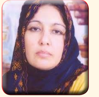
بقلم / سهام عز الدين جبريل

الوطن وسلامته ومسؤولية إستقراره ، والتي لم تعد مهمة سهلة في ظل تطور أليات الحروب والصراعات والايغال الجديدة من الحروب بأشكالها المألوفة والمستجدة ، فإن اعتقد البعض او تمنى ان تكون حرب أكتوبر هي آخر الحروب في المنطقة ، ولكن مازال هناك الجديد من الحروب ونماذجها الجديدة بهدف هدم الاوطان وهز إستقرارها ، وتبقى حرب أكتوبر معلم من معالم الطريق نستمد منها قيمة