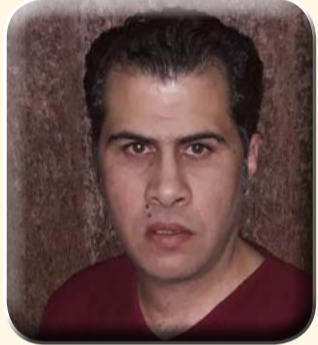
كتب حسين الطنجير

مضامرسباق الهجن الدولي الاول بشرم الشيخ.