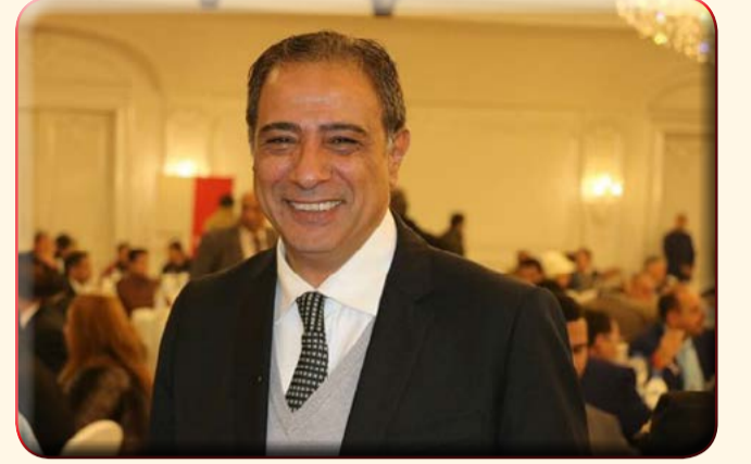
بقلم اللواء ناصر قطامش

تحدث اليوم عن أحد الأبطال المصريين الذين أصابوا إسرائيل خلال حرب الاستنزاف (٦١) أكتوبر الرعب والهلع وهو الشهيد إبراهيم الرفاعي أسطوره الصاعقه المصريه والذي لقبته اسرائيل (بالشبح) من مواليد قرية الخلالة - مركز بلقاس بمحافظة الدقهلية في ٢٧ يونيو عام ١٩٣١، وقد ورث عن جده والد والدته (الأميرالاي) عبد الوهاب لبيب التقاليد العسكرية والرغبة في التضحية فداءً للوطن، كما كان نشأته وسط أسرة متمسكة بالقيم الدينية أكبر الأثر على ثقافته وأخلاقه. بعد معارك ١٩٦٧ وفي يوم ٥ أغسطس ١٩٦٨ بدأت قيادة القوات المسلحة في تشكيل مجموعة صغيرة من الفدائيين للقيام ببعض العمليات الخاصة في سيناء، باسم فرع العمليات الخاصة التابعة للمخابرات الحربية والاستطلاع كمشاهدة من القيادة لاستعادة القوات المسلحة ثقتها بنفسها والقضاء على إحساس العدو الإسرائيلي بالأمن، وأمر من مدير إدارة المخابرات الحربية اللواء محمد أحمد صادق وقع الاختيار على البطل / إبراهيم الرفاعي لقيادة هذه المجموعة، فبدأ على الفور في اختيار العناصر الصالحة، كانت أول عمليات هذه المجموعة نسف قطار العدو عند 'الشيخ زويد' ثم نسف 'مخازن الذخيرة' التي تركتها قواتنا عند انسحابها من معارك ١٩٦٧، وبعد هاتين العمليتين الناجحتين كبرت المجموعة التي يقودها البطل وصار الانضمام إليها شرفاً يسعى إليه الكثيرون من أبناء القوات المسلحة، وزادت العمليات الناجحة ووطأت أقدام جنود المجموعة الباسلة مناطق كثيرة