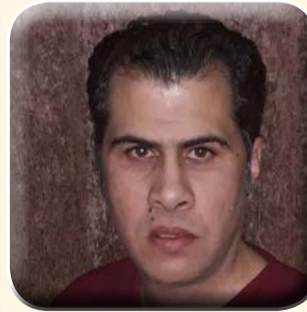
كتب حسين الطنجير

الرسمية للغات ومدرسة الشيخ محمد متولى الشعراوي الابتدائية واختتمها بزيارة لمدرسة الشهيد مقدم شريف محمد عمر الثانوية بنات. وعبروا الطلاب عن فرحتهم بالزيارة بحيث قام الطلاب الموهوبين بغناء عدد من الاغاني الوطنية وعزف السلام الوطني وكانت سعادتهم بالغة وتقدموا بالشكر للمستشار على هذه اللفتة الطيبة.