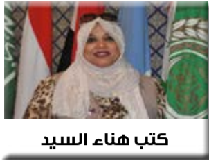
كتب هناء السيد

صدر اليوم الأربعاء ١٤ ربيع الثاني ١٤٤١ هجري الموافق ١١ ديسمبر ٢٠١٩م.