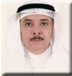
بقلم/ الأستاذ الدكتور