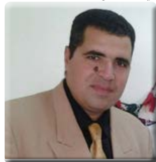
فيصل ابو هاشم شمال سيناء

مرة أخرى بدلا من الاسماعيلية تسيرا على المتقاضين والمحامين وجميع المواطنين . وأشار المحافظ الى مشروع التحول الرقمي الذي يتم تطبيقه على المحافظة وصل الى نسبة ٨٥ ٪ من مختلف القطاعات لتوظيف التكنولوجيا لخدمة المواطنين في شتى الخدمات التي تقدمها مؤسسات الدولة . وعقب الافتتاح .. قام المحافظ والمستشار مساعد وزير العدل والمستشار رئيس المحكمة والمستشارين والمحامين بتفقد مشروعات التطوير ومكاتب الخدمات المختلفة .. الى جانب رفع الكفاءة بالمحكمة الابتدائية والجزئية ومبنى نقابة المحامين . حضر الافتتاح أعضاء المجموعة البرلمانية لمجلسي الشيوخ والنواب وعدد من القيادات وأهالي المحافظة .