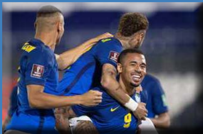
في آخر ٩ مباريات سجل خلالها نيمار ٢٠٢٢ بنتيجة ٢-٠. في ١٨ مباراة فاز في ١٦ وتعادل في ٢. واستطاع منتخب البرازيل تحقيق الفوز

واصل منتخب البرازيل سلسلة الانتصارات وتعادل رقمه القياسي بالفوز على باراجواي في تصفيات كأس العالم ٢٠٢٢ بنتيجة ٢-٠.