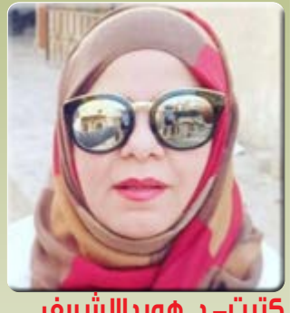
كُتبت - د. هويدا الشريف

المنطقة الصناعية بالعريش يقوم بتكلفة ٥٠ مليون جنيهها ويضم عدد ٤٧ ورشة حرفية .. يتم تجهيز عدد ٤٣ ورشة منها مختلف الأدوات والمعدات في الأنشطة الحرفية المتنوعة ، والتي من بينها التجارة والألومنيال والكريتال وتعبئة المواد الغذائية والصناعات البلاستيكية وكبس الخراطيم وغير ذلك من الصناعات الحرفية . ومن جانبه .. أعلن المهندس محمد رضوان وكيل وزارة الاسكان والمرافق بمحافظة شمال سيناء أن اقامة المجمع يهدف الى تجميع الورش وإخلاء مدينة العريش منها .