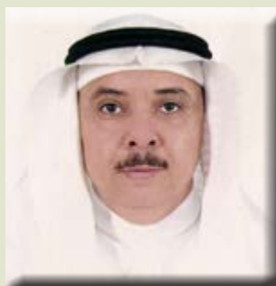
بقلم/ الأستاذ الدكتور محمد بن عبد الرحيم شاهين

في حين يجب أن تحصل النساء اللاتي تزيد أعمارهن عن ٥٠ سنة على ١٢٠٠ ملجم من الكالسيوم يوميًا، أما الأطفال فينصح أن يحصلوا على حوالي ١٣٠٠ ملجم من الكالسيوم يوميًا. ويمكن للجسم الحصول عليه من خلال تناول الأطعمة الغنية به مثل بعض الخضار والفاكهة. وهناك العديد من النباتات الغنية بالكالسيوم، والتي يمكنها أن تمد جسم الإنسان به، نذكر منها التالي: التين المجفف، وهو مصدر مهم للكالسيوم، حيث يحتوي كل ١٠٠ جم من التين المجفف على ١٦٢ ملجم من الكالسيوم، أي ما يعادل ١٦٪ من الكمية المطلوبة في اليوم الواحد، التمر، التي تحتوي على ٦٤ ملجم من الكالسيوم في كل ١٠٠ جم، أي ما يعادل ٦٪ من احتياجات الجسم