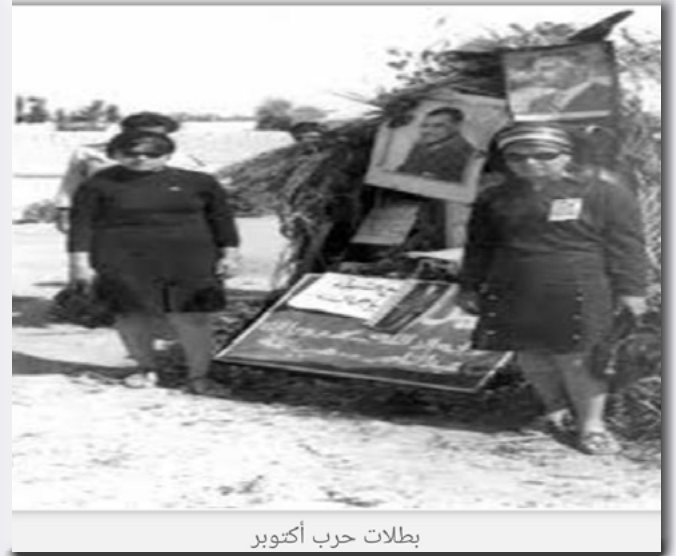
بطلات حرب أكتوبر