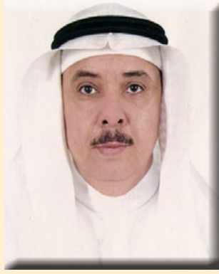
بقلم/ الأستاذ الدكتور محمد بن عبد الرحيم شاهين

مثل الملاريا في العديد من الدول حول العالم، كما استخدمت كمكون غذائي، وتم استهلاكها في شكل مستخلص، مسحوق، ولعصارة أوراق الزيتون فائدة عظيمة في الوقاية من العديد من الأمراض وحتى في علاجها، لأنها تحتوي على مضادات أكسدة قوية ومضادات حيوية ولها تأثير مضاد لنشاط الفيروسات والفطريات والطفيليات، كما أنها تساعد في التغلب على مشاكل الهضم وتزيد مناعة الجسم. فلقد وجد أنها تحتوي على العديد من المركبات النشطة بيولوجيا التي لها نشاطات مضادة للأكسدة، كما أنها تعمل على خفض ارتفاع ضغط الدم، ومضادة للالتهابات، ومخفضة لسكر