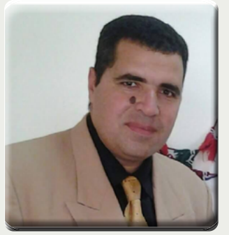
كتب فيصل ابو هاشم

أدوات كهربائية متنوعة وسلع معمرة من إنتاج المصانع الحربية، وبأسعار مخفضة، حيث أن البيع بسعر المصنع وبتخفيض بنسبة ١٠٪ عن الأسواق الخارجية. أضاف المحافظ، أن الشهر القادم