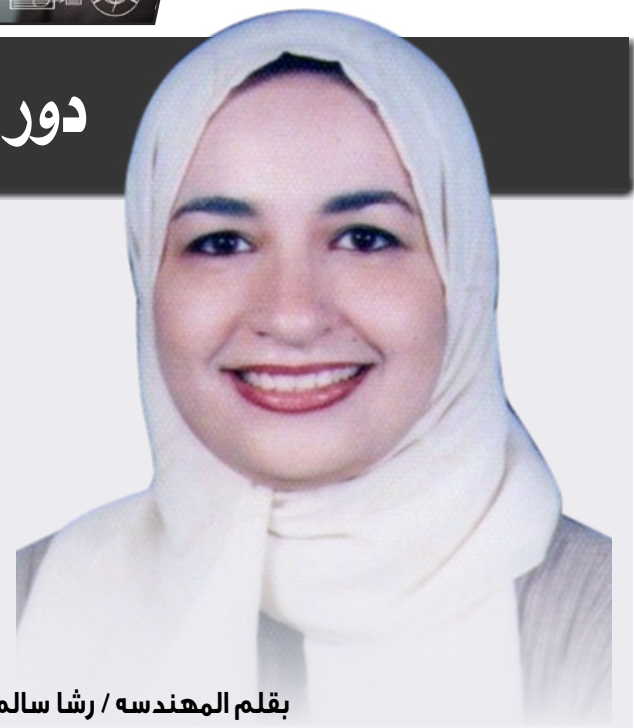
بقلم المهندس / رشا سالم

تم تكليفها لرصد حجم القوات الإسرائيلية في وسط سيناء بالإضافة إلى تأمين طرق للفدائيين