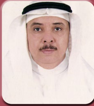
بقلم/ الأستاذ الدكتور محمد بن عبد الرحيم شاهين

يقضي على البكتيريا والآلام، ويكون ذلك عن طريق إضافة ملعقة صغيرة منه في كوب من الماء الساخن وشربه قبل تناول أية أغذية مجمدة أو بعد الإصابة بالتسمم، عسل النحل وهو من أكثر أنواع الأغذية التي تعالج التسمم الغذائي، حيث يساهم في علاج آثاره والمضاعفات التي يتسبب فيها، ويكون ذلك عن طريق مزج ثلاث ملاعق من عسل النحل مع كوب من الماء الدافئ وشربها أربع مرات يومياً، الماء والسوائل الطبيعية التي تساهم في تعويض الجسم عما فقده من سوائل وأملاح، عصير الليمون الممتزج بكوب من الماء الذي يساهم في التخلص من البكتيريا التي توجد في الجهاز الهضمي، ويطهر البطن، ويهدئ من التهاباتها. كما يساهم تناول الزنجبيل