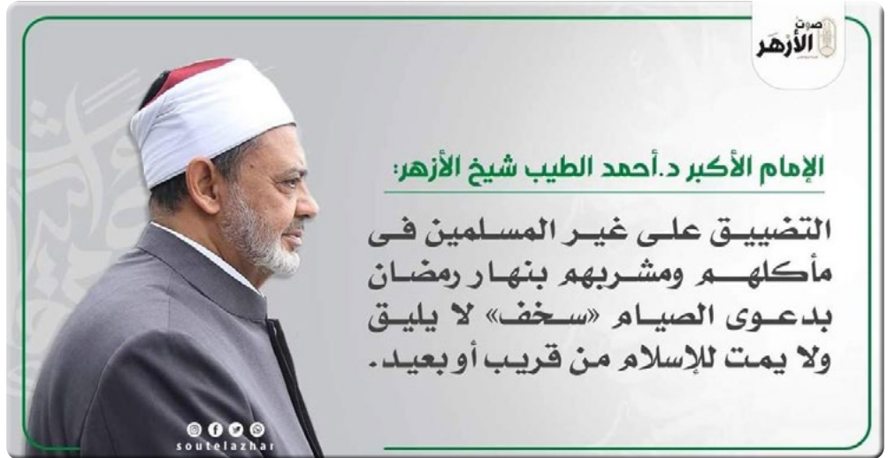
الإمام الأكبر د. أحمد الطيب شيخ الأزهر: