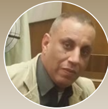
كتب : ماهر بدر

المشاركة لتنفيذ المشروعات بمعدلات سريعة وإستخدام أحدث الوسائل والمعدات لتحقيق الهدف المنشود من المبادرة وحل أي مشكلة تطرأ على أرض الواقع على الفور نظراً لأهمية المبادرة كمشروع قومي عملاق يهدف إلى تحسين جودة الحياة وإحداث تغيير جوهري في حياة ومستوى معيشة الفئات المجتمعية الأكثر إحتياجاً وتوفير عيشة كريمة في ضوء التنمية الشاملة والبناء المستمر الذي تشهده الدولة.