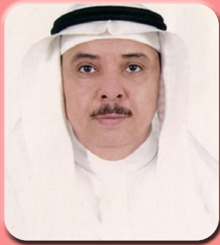
بقلم/ الأستاذ الدكتور محمد بن عبد الرحيم شاهين

ارتفاعها إلى ١٠ أمتار في مناطق أخرى، وهو أحد أفراد العائلة البقولية. الأوراق متناوبة مع ٢،٢ إلى ٤ أمتار، والأزهار أرجوانية ذات رائحة قوية، والثمرة عبارة عن جراب بقولي كبير، صلب، خشبي، مفصل به من بذرة واحدة إلى ثماني بذور، والبذور حمراء زاهية، صلبة السطح وطولها حوالي ٠,٢ متر. وتعتبر مادتي كوينوليزدين Quinolizidina، ستيسين Cystisine سبب التسمم، أما خواص التوكسين فتشبه النيكوتين، وهو منبه شم يعقبه هبوط في التنفس. وتعد البذور المطحونة أو الممضوعة أكثر سمية من أوراق