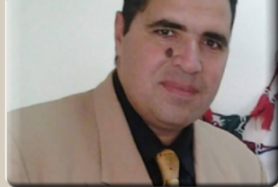
كتب فيصل ابو هاشم

يقوم اللواء دكتور محمد عبد الفضيل شوشة محافظ شمال سيناء، بإفتتاح ووضع حجر الأساس لعدد ٨ مشروعات بمختلف مدن المحافظة، وذلك بمناسبة العيد القومي للمحافظة. وأكد المحافظ على افتتاح مسجد