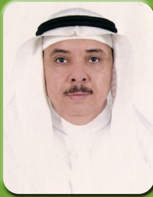
بقلم/ الأستاذ الدكتور محمد بن عبد الرحيم شاهين

على مادة اليوجانيول، وهي إحدى زيوت الطيارة التي تمنع عمل الإنزيمات المسببة للالتهابات، فهو يعمل مثل المسكنات (الأسبرين، والبروفين، والبارامول)، ويستخدم الريحان بكفاءة عالية في علاج الروماتيزم، والتهابات الأمعاء. ويحتوي الريحان على فيتامين أ في صورة بيتا كاروتين (مادة مضادة للأكسدة) التي تتحول إلى فيتامين (أ) الذي يحمي الكثير من الأعضاء، والأوعية الدموية، ويمنع ترسب الكوليسترول في الأوعية الدموية، وبالتالي يحمي القلب من أمراض كثيرة مثل تصلب الشرايين و الذبحة الصدرية. كما أن مادة البيت كاروتين تقلل من أخطار الإصابة بالأمراض القلبية، وهشاشة العظام، والروماتيزم. ويحتوي الريحان على عنصر المغنسيوم الذي يدعم عضلات القلب والأوعية الدموية، وينظم معدل ضربات القلب. وتشير الدراسات إلى أن الريحان يمكن أن يساعد في خفض مستويات السكر في الدم، وخفض الدهون الثلاثية، ومستوى الكوليسترول الكلي، وخفض ضغط الدم، كما أنه قد يعزز إفراز الأنسولين لتعزيز صحة مريض السكري، ويقلل من هرمون الكورتيزول، الذي يمكن أن يسبب زيادة الوزن، ومع ذلك لم يتم بعد تأكيد استخدام الريحان لإنقاص الوزن عن طريق