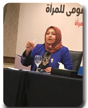
بقلم / سهام عزالدين جبريل

كان بيتنا قريب من مطار العريش و كنا اطفالاً نتشبت بازبال اتواب امهاتنا نجري ورائهن ونبكي، وصعدنا مع اهالينا و جيراننا الي سطح البيت، كانت الناس تهلل لما سمعته من أخبار سارة، الراديو مازال يعلن ويعلن تساقط طائرات العدو تباعا لقد انتصرنا ونحن نزحف الى ابواب تل بيب وواقعا الذي نراه يجسد صورة مفزعة، أننا امام مشهد طائرات غربية نراها على مرأى العين تقصف بالجوار، بينما الدخان الأسود يتصاعد من المطار لقد كانت هناك طائرات مربية تضرب المطار وضربت مدارج الطائرات في كل مطارات مصر، ونحن لازلنا نهلل لانتصار مزيف وتساءل الاهالي هل هذا انتصار ام انكسار عشنا حالة من الوهم واختلال التوازن الذي يؤدي الي كارثة صباح يوم ٥ يونيو ٦٧ تلك الأحداث التي اغتالت طفولتنا إنه تاريخ الجرح الكبير، وعم المساء وخيم الظلام وسكن الألم في قلوب الجميع، حتى قلوبنا الصغيرة سكنها الألم لم تعد نلعب ونلهو مثل كل الأطفال لم تعد هناك مدارس لم تعد هناك شوارع وأزقة حارات نلعب فيها مع أصحابنا