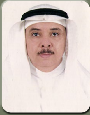
بقلم/ الأستاذ الدكتور محمد بن عبد الرحيم شاهين

للتقلصات، وعلاج الإسهال، وكمادة قابضة، وكخافضة للخصوبة، وكمقاومة للأكسدة، وكمضادة لتجمع الصفائح الدموية، وفي محاربة إنزيم البروتيز HIV-1 Protease اللازم لاستمرار حياة فيروس نقص المناعة البشرية. وتستخدم بذور شجرة السنط العربي كمادة محفزة للتقلصات، ومضادة للتفيليات التي يمكن أن تسبب الملاريا. وتستخدم لحائها كمضاد بكتيري، ومضاد للأكسدة، ومضاد لتكون الطفرات، وقاتل للخلايا، ومادة مطرية، ومُدّر للبول، وطارِد للبلغم، ومُنشِّط جنسي، ومقيئ، ومُعَدِّ، وفي حالات الزيف، وتقرحات الجروح، والجذام، والبهاق، والجذري، والأمراض الجلدية، والمغص المتعلق بالعصارة الصفراء الذي ينتج عن خلل في الكبد أو المرارة، والشعور بالحرق، وألم الأسنان، وعلاج الزحار. كما يُستخدم لحائها في علاج حالات البرد، والتهاب القصبات الهوائية،