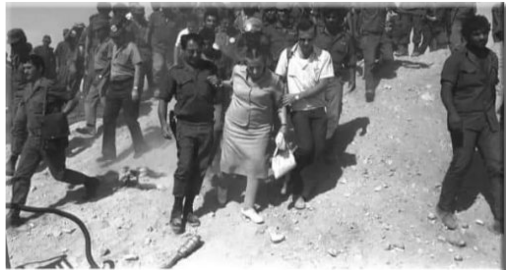
غولדה ماير מבקרת באחד המוצבים, ומשמאלה האלוף גונן (מלחמת יום כיפור), צילום: شغب يضحك

أنه "لم أجد خطة أو فكرة مكتوبة أو شفوية عندما أتيت إلى القيادة الجنوبية لإخلاء معاقليها أثناء الحرب، لا في مرحلة مبكرة ولا في مرحلة متأخرة، من ناحية أخرى، تنص الخطة الحالية على عدم إخلاء المعاقل". كما ألقى جوروديش باللوم على رئيس الأركان ديفيد إلعازار في عدم إخلاء المعاقل ويقول إن "المشكلة تكمن في أنه بينما كان من الممكن إنقاذ سكان المعاقل بقناة السويس ليلة السبت". أمره رئيس الأركان بإخلاء معاقل هامشية فقط". قللنا من شأن المحارب المصري في شهادته، أشار الجنرال جوين أيضاً إلى مفهوم الجيش الإسرائيلي لمستوى القتال للمقاتلين المصريين، وهو قتال تم التقليل من شأنه، ويقول: "في رأيي، لم يكن النجاح المصري في المرحلة الأولى لأن مفهوم الدفاع كان صحيحاً. أو خطأ، ولكن لأن خططنا الدفاعية كانت مبنية على تقييم تجريبي لمحارب مصري معين وفي هذه الحرب