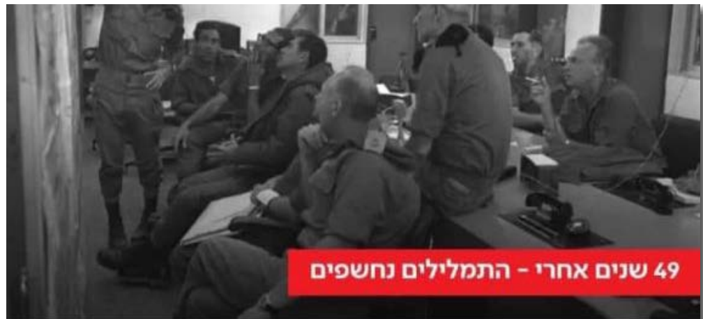
49 שנים אחרי - התמלילים נחשפים

الغفران: لم تكن هناك خطة.. أخطأنا في تقدير الجيش المصري. تدرّبنا على موجه الجندي المصري.. لكن عندما اندلعت الحرب وجدناه الجندي المصري شيء وما تدرّبنا عليه شيء آخر. سمعت خبر عزلي في الراديو.. وشارون لم ينفذ أوامر القادة ولا حتى رئيس الأركان. بم أرى سلاح الجو الإسرائيلي ولم أجد من يحميني على الأرض عن أرييل شارون قائد الفرقة ١٤٣