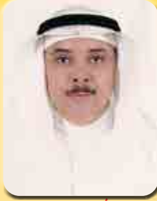
بقلم/ الأستاذ الدكتور محمد بن عبد الرحيم شاهين

والكيمياء النباتية عام ٢٠١٢م. ويمكن الحصول على فوائد الموز للبشرة بعمل قناع للوجه عن طريق إضافة ملعقة عسل إلى ثمرة موز مهروسة جيدا، ووضعه على الوجه والرقبة مع تجنب منطقة العين، ويترك القناع لمدة ربع ساعة ثم يشطف بالماء الدافئ. وتشمل فوائد استخدام قناع الموز على ترطيب الجلد الجاف، وإزالة خلايا الجلد الميتة، والحفاظ على البشرة خالية من التجاعيد، وكذلك التخلص من حروق الشمس. كما يمكن التخلص من حب الشباب بعمل قناع مكون من ثمرة موز مقشرة مخلوطة مع ملعقتين عسل وملعقة عصير الليمون بواسطة الخلاط لمدة ٣٠ ثانية، ومن ثم غسل الوجه بالماء الدافئ قبل وضع هذا القناع على الوجه لمدة ٢٠ دقيقة، وبعد ذلك غسل الوجه بالماء البارد.