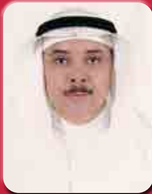
بقلم/ الأستاذ الدكتور محمد بن عبد الرحيم شاهين

لتقلصات الرحم، المعدة، الأمعاء. كما يحتوي الكردي على مضادات أكسدة قوية جداً تساعد الجسم في محاربة الجذور الحرة وتقوية المناعة، والوقاية من العديد من الالتهابات والمشاكل مثل التهابات المفاصل والعظام والسرطانات وأمراض القلب والزهايمر والعديد من الأمراض الأخرى. كما أن له دور في محاربة علامات الشيخوخة والتجاعيد لاحتوائه على معدلات عالية من البوليفينول، وهو مضاد أكسدة قوي يساعد بشكل خاص على الوقاية من سرطان المعدة. وقد أثبتت الدراسات العلمية أن للكردي دور في خفض نسبة الكوليسترول السيئ في الدم لدى مرضى السكري، وزيادة الكوليسترول