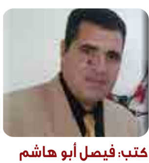
كتب: فيصل أبو هاشم

كما هنا الأزهر الشريف الرئيس وجمعوع المصريين بذكرى ثورة ٢٥ يناير المجيدة، التي كتبت فصلاً جديداً في تاريخ النضال المصري والسعي نحو النهوض بالوطن، سائلاً المولى -عز وجل- أن يوفق رئيسنا إلى مواصلة مسيرة البناء والتنمية، وأن يهيب لمصرنا كل أسباب الرخاء والاستقرار، وأن يحفظ مصر وشعبها من كل مكروه وسوء عن الوطن، فسقطوا بذلك صفحة من صفحات الشرف والفخر في التاريخ المصري، لتظل هذه الذكرى تاريخاً تتجدد معه عزيمة المصريين كل عام من أجل العمل والبناء والعطاء للوطن. ثورة ٢٥ يناير. وأعرب الأزهر الشريف عن اعتزازه وتقديره لما قدّمه رجال الشرطة البواسل في ملحمة الإسمايلية من تضحياتٍ غالية وبذلوا أرواحهم في سبيل حفظ الأمن والاستقرار والدفاع