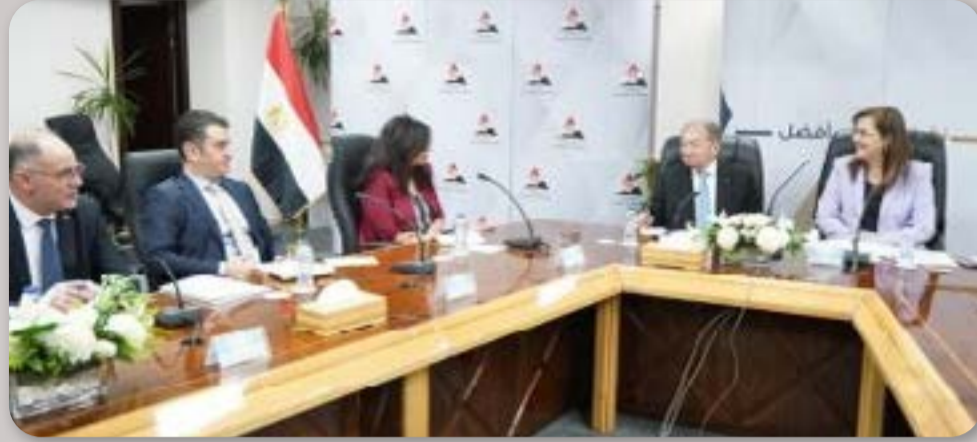
كما أشارت السعيد إلى دور الصندوق مصر السيادي الذي يعد الذراع

الاستثماري للدولة ويهدف إلى مزيد من الاستثمارات ودعم القطاع الخاص. وأوضحت السعيد أن هناك مجموعة من الجهات التابعة للوزارة، مشيرة إلى معهد التخطيط القومي، والمعهد القومي للحكومة والتنمية المستدامة والذي يضم مركز للحكومة وآخر للتنمية المستدامة بالإضافة إلى مركز لريادة الأعمال والمركز الديموجرافي، كما يتبع الوزارة كذلك الجهاز المركزي للتعبئة العامة والإحصاء. من جانبه، أعرب خالد العسيلي، وزير الاقتصاد الفلسطيني عن امتنانه لعقد اللقاء، مستعرضاً مهام وتخصصات وزارة الاقتصاد الفلسطينية، مؤكداً أهمية العلاقات المصرية الفلسطينية على كل المستويات، معرباً عن تطلعه لأن تكون