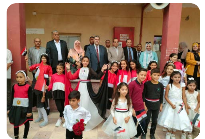
تفقد اللواء دكتور محمد عبد الفضيل شوشة، محافظ شمال سيناء، يرافقه اللواء يسري عبد الله، مساعد وزير التربية والتعليم