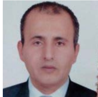
إعداد سعيد شفيق