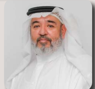
بقلم المستشار / غسان غازي عنبر

وسوف يستغرق هذا الموضوع سلسله من المقالات ابدئها في المقال الأول ب صك حصر الورثه ثم حصر التركة (صك حصر الورثه) قيام احد الورثه بتقديم طلب اصدار صك حصر الورثه ببيان الورثه (الاب والام والجد والجده والزوجه او الزوجات والابناء) وفي بعض الأحيان يكتشف بعد اصدار صك حصر الورثه ان للمتوفي زوج غير معلوم او أبناء غير موثقين ونصحتي للورثه قبل اصدار صك الحصر وفي حال وجود شكك التأكد من عدم وجود زوجات اخريات بسؤال اصدقائه المقربين او البحث في مستنداته ثم التقدم بطلب اصدار