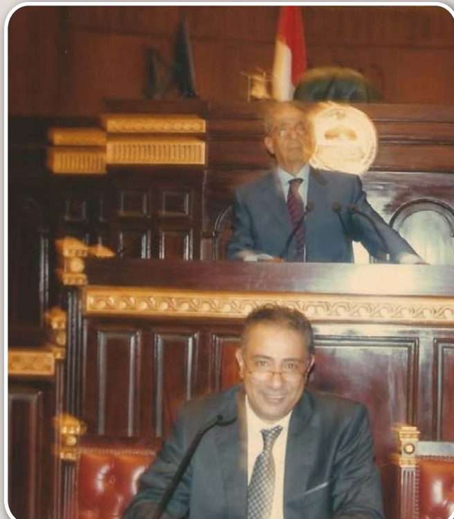
لواء / ناصر قطامش

لواء / ناصر قطامش نائب رئيس حزب المصريين الاحرار