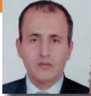
إعداد / سعيد شفيق