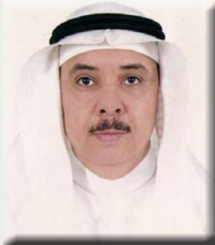
بقلم/ الأستاذ الدكتور محمد بن عبد الرحيم شاهين

البقدونس نبات عشبي ثنائي الحول، ينتمي إلى الفصيلة الخيمية، ويُستعمل كغذاء وتزيين به أطباق الطعام، كما أنه يُستعمل كنوع من التوابل لإضافة النكهات على الأطعمة. وتستخدم الزيوت النباتية الناتجة منه لإنتاج العطور والعوامل المعطرة في الصابون أو الكريمات. وقد استخدم في قديم الزمان كدواء قبل استخدامه كمادة مضافة للغذاء. ويعتبر البقدونس مصدرًا هامًا للعديد من الفيتامينات والعناصر الغذائية والمواد الفعالة التي تعتبر مسؤولة عن التأثيرات الصحية للإنسان. فتناول البقدونس يوميًا يساهم في دعم صحة الجهاز الهضمي، ويرجع ذلك جزئيًا إلى دوره في دعم الكبد، فهو يزيد من مستويات الجلوتاثيون المضاد للأكسدة الرئيسية في الكبد، وتدعيم أيضا الإنزيمات المضادة للأكسدة الأخرى. وقد ثبت أن البقدونس يمكن أن يعمل على تجديد أنسجة الكبد بعد الأضرار الناجمة عن الأمراض المزمنة. كما يحفز البقدونس إنتاج العصارة الصفراوية في الكبد اللازمة لهضم الدهون في الأمعاء، حيث أن نقصها يساهم في سوء الهضم، والنمو الجرثومي، والاضطرابات الهرمونية، كما أنها ضرورية لإفراز السموم التي يتم