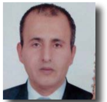
إعداد | سعيد شفيق أفقياً