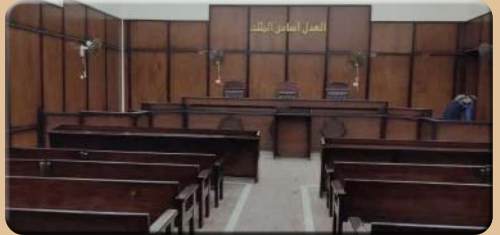
قررت النيابة العامة بمحكمة جنوب القاهرة، إحالة ربة المختصة، لاتهامهما بالتعدى على نجله زوجها من ذوى الهمم فى منطقة المقطم.

– تفاصيل الواقعة بدأت عندما تلقى قسم شرطة المقطم بلاغاً من سيدة تتهم طليقها وزوجته بتعذيب ابنتها "من ذوى الهمم"، وعلى الفور انتقل رجال مباحث محل بلاغ تم صحة البلاغ، ليتم ضبط الأب لسماع أقواله فى بلاغ والدة الفتاة، وسرعة ضبط وإحضار زوجة الأب الهاربة. وقال والد المجنى عليها خلال تحقيقات النيابة، إنه لم يكن يعرف شيئاً عن فيديو تعذيب نجلته، ولكنه تفاجأ بوجود فيديو تظهر فيه الفتاة مصابة فى جسدها جراء بعض الحروق،