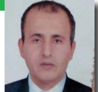
إعداد سعيد شفيق